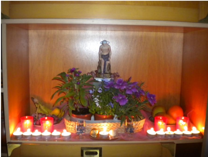
FOTOGRAFÍA 1. Trono de Babalú Ayé (San Lázaro) La Laguna. Tenerife. Autora: Greyc Pérez Amores.