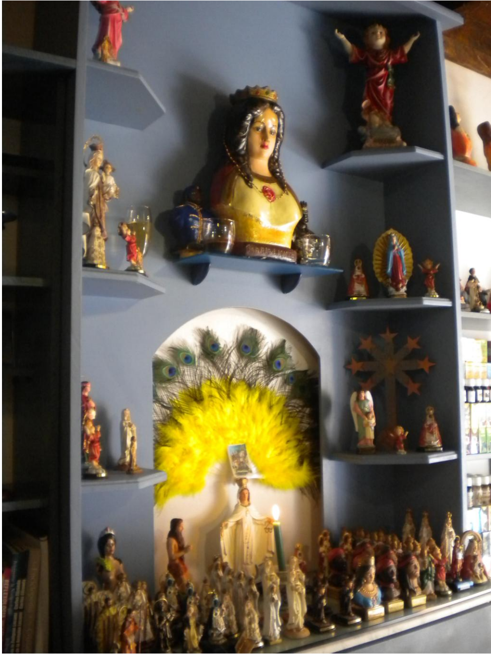
FOTOGRAFÍA 5. Tiendas y santos en Tenerife.