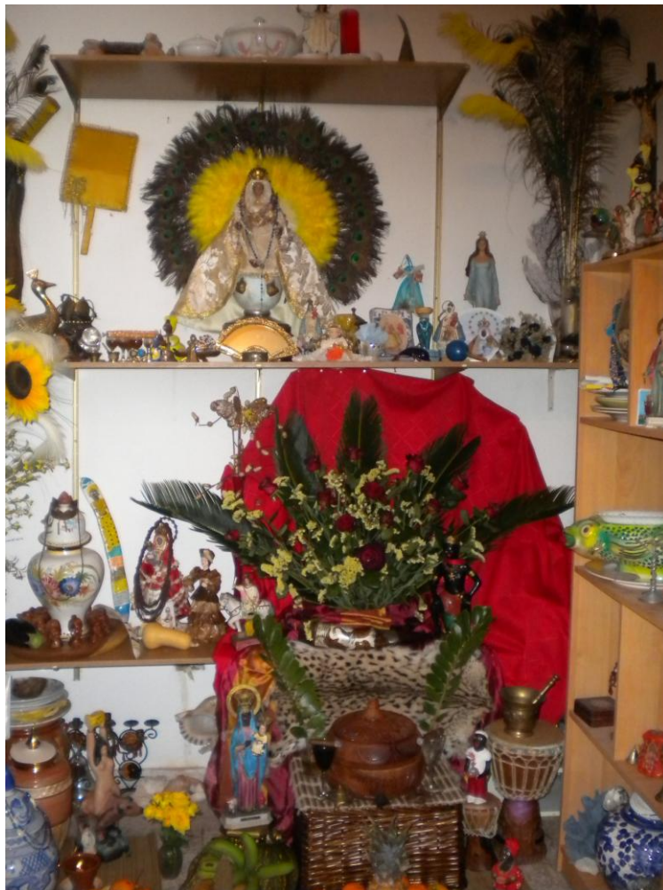
FOTOGRAFÍA 2. Trono de Changó (Santa Barbara) Arafo. Tenerife.