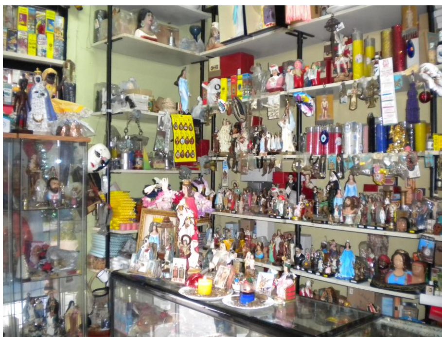
FOTOGRAFÍA 4. Tienda esotérica en Santa Cruz de Tenerife.